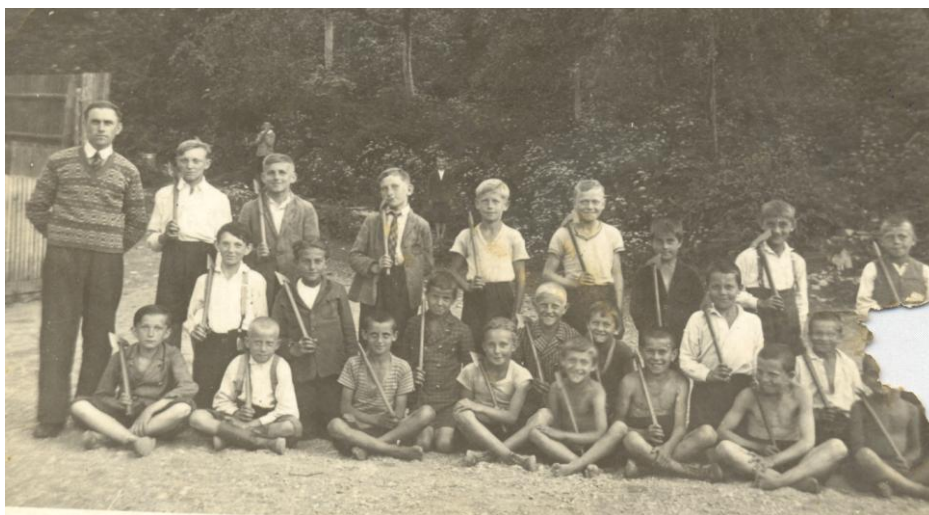
Rok 1931: cvičení žactva se sekyrkami 1